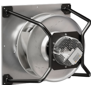
EC Radialventilatoren – RadiPac Tragspinnenkonstruktion Baugrößen 250 - 800